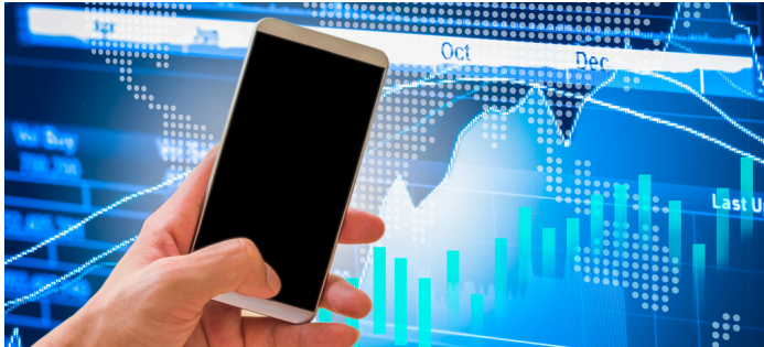
Principales Índices - Renta Variable y Fija

A la aplicación del vehículo de Inversión