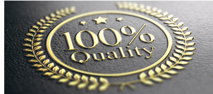
Selección de Productos