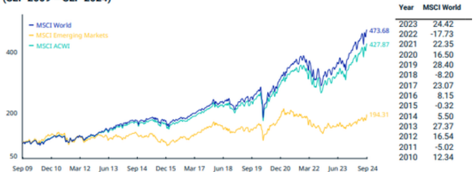
CUMULATIVE INDEX PERFORMANCE – GROSS RETURNS (USD) (SEP 2009 – SEP 2024)